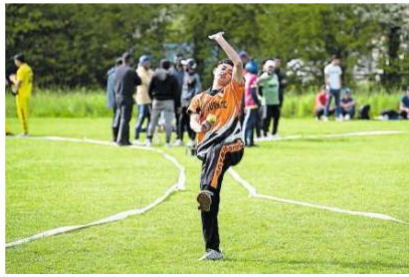
Ein Bowler wirft einen Ball am internationalen Cricket-Turnier in Grenchen, das der Cricket Club Olten organisierte.

ein Gefäss zum Mitgestalten», sagt sie. «Und hier können sie zeigen, was sie können.» Viele der jungen Männer bringen jah-